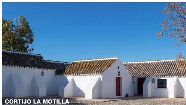
CORTIJO LA MOTILLA