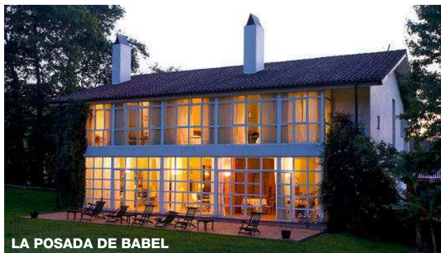
LA POSADA DE BABEL