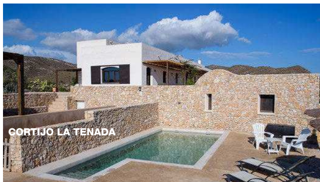
CORTIJO LA TENADA