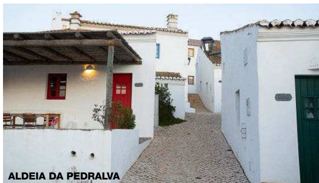
ALDEIA DA PEDRALVA