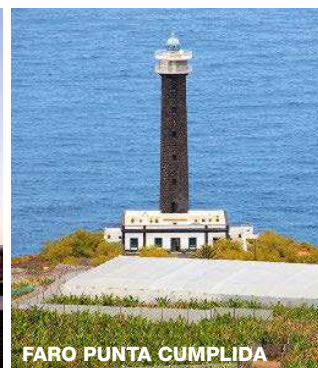
FARO PUNTA CUMPLIDA